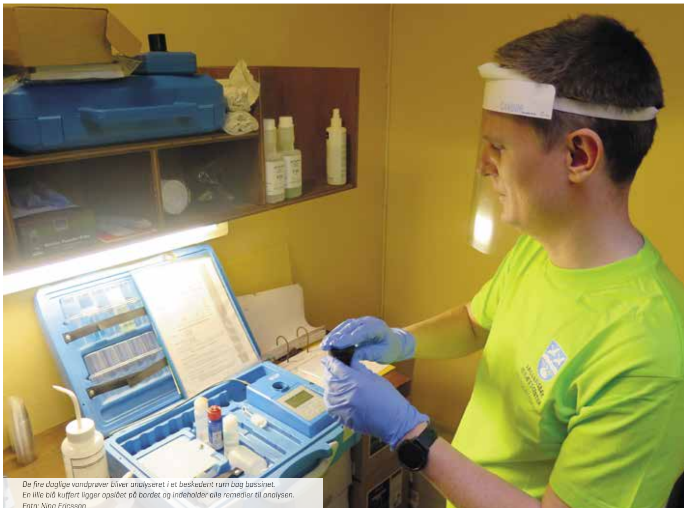
De fire daglige vandprøver bliver analyseret i et beskedent rum bag bassinet. En lille blå kuffert ligger opslået på bordet og indeholder alle remedier til analysen.

reagensglasset ned i analyseapparatet, som ikke er større end en værktøjskuffert og ligner et kemisæt fra folkeskolen. Resultaterne bliver skrevet ned på et ark papir ved siden af. Helt lavpraktisk og uden computere.