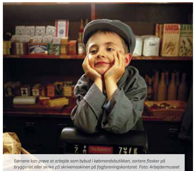
Børnene kan prøve at arbejde som bybud i købmandsbutikken, sortere flasker på bryggeriet eller skrive på skrivemaskinen på fagforeningskontoret.

Du kan bestille billetter på forhånd og på den måde sikre, at der er plads til jer, når I ankommer. Ved ankomsten skal du dokumentere, at du er medlem af FOA 1. Det kan du fx gøre ved at vise, at du har modtaget det seneste FOA 1-nyhedsbrev på mail. Du kan også tage din FOA 1-lommekander med eller vise en udgave af Etteren, din kontingentopkrævning eller andet. Følg med i coronaretningslinjerne på arbejdermuseet.dk.