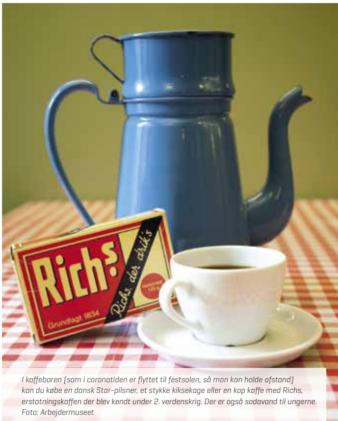
I kaffebaren (som i coronatiden er flyttet til festsalen, så man kan holde afstand) kan du købe en dansk Star-pilsner, et stykke kiksekage eller en kop kaffe med Rich's, erstatningskaffen der blev kendt under 2. verdenskrig. Der er også sodavand til ungerne.

Som noget nyt kan du som medlem af FOA 1 komme gratis ind på Arbejdermuseet. Og du kan tage din ægtefælle/samlever og jeres hjemmeboende børn med.